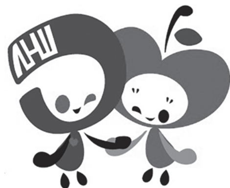
青森県立保健大学 マスコットキャラクター モーリーとリンリン