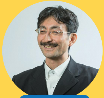
講師プロフィール

青森県出身。青森大学客員教授の他、(株)キャンサーズキャン顧問、横浜市行動デザインチームアドバイザー、OZMA Nudge Social Design Unitアドバイザー、政府の日本版ナッジ・ユニットの有識者委員などを通じ、行政や企業のナッジ戦略を支援。ナッジを紹介したTEDxトークは、YouTubeで60万回以上再生されている。代表作は「DVD 実践者のナッジ」(東京法規出版)、「ナッジ×ヘルスリテラシー」(大修館書店:分担執筆)。